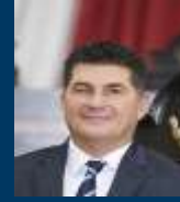
Dip. Miguel Ángel Gómez Orta