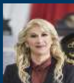
Dip. Nohemí Estrella Leal