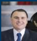
Dip. Gerardo Peña Flores